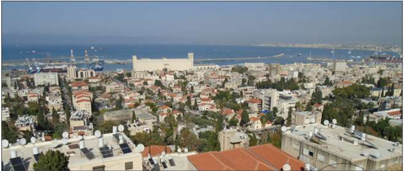
„Gebetswohnung“ am Karmel – Blick auf die Bucht von Haifa

Die Gebets- und Gästewohnung steht für alle zur Verfügung, die ihre Zweckbestimmung unterstützen und fördern - vorzugsweise für Gebetsteams !!!